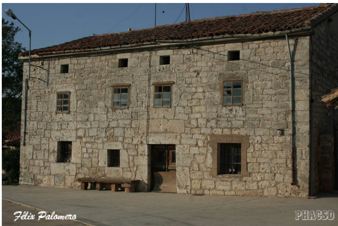
Espinosa de Juarros: arquitectura popular.