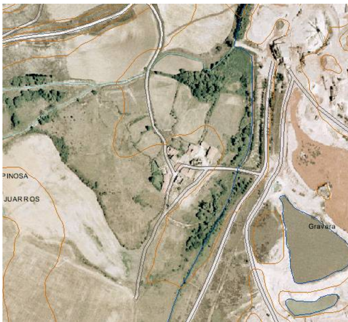
Espinosa de Juarros: foto área.