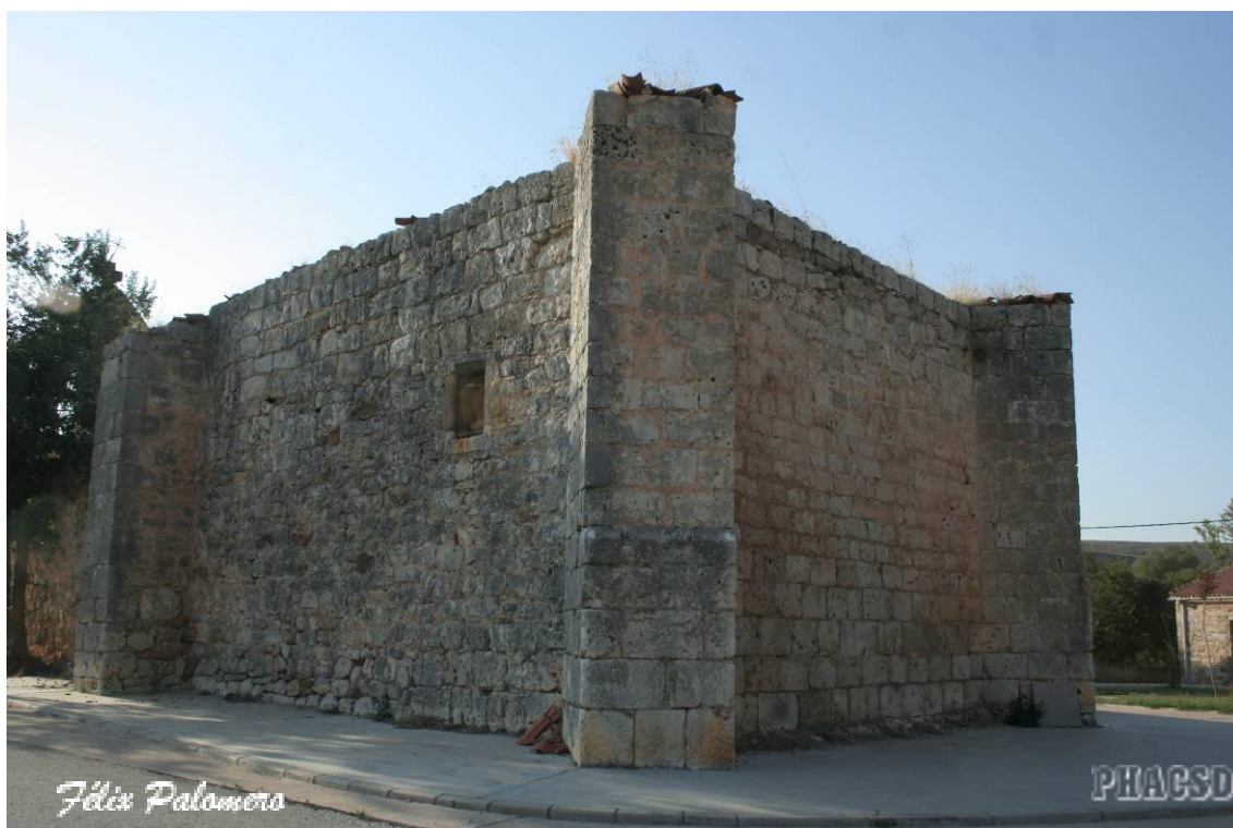
Espinosa de Juarros: cabecera del templo parroquial en ruinas.