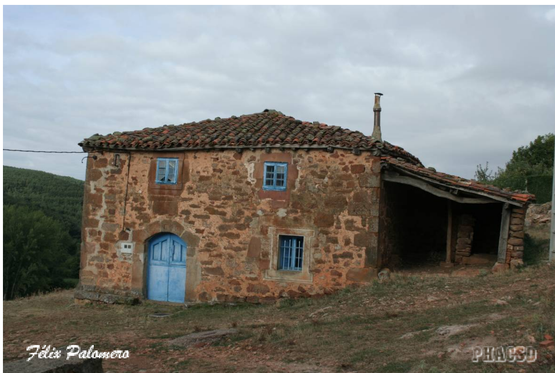
Brieua de Juarros: arquitectura popular.