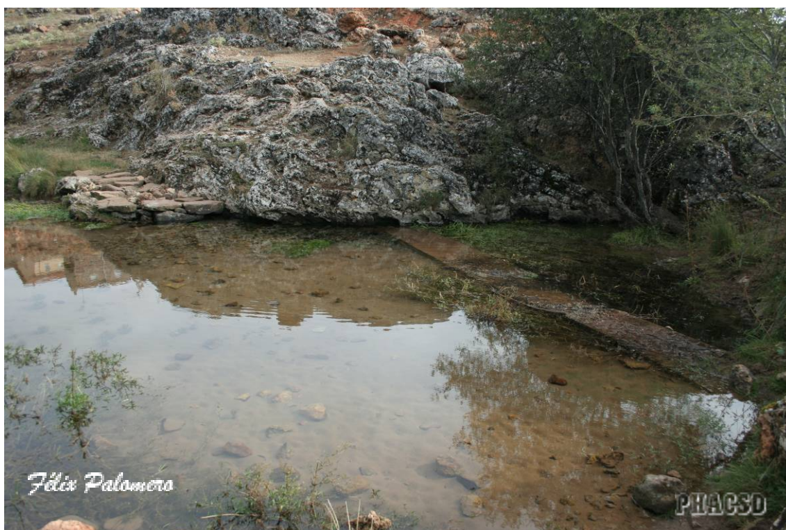
Brieva de Juarros: fuente.