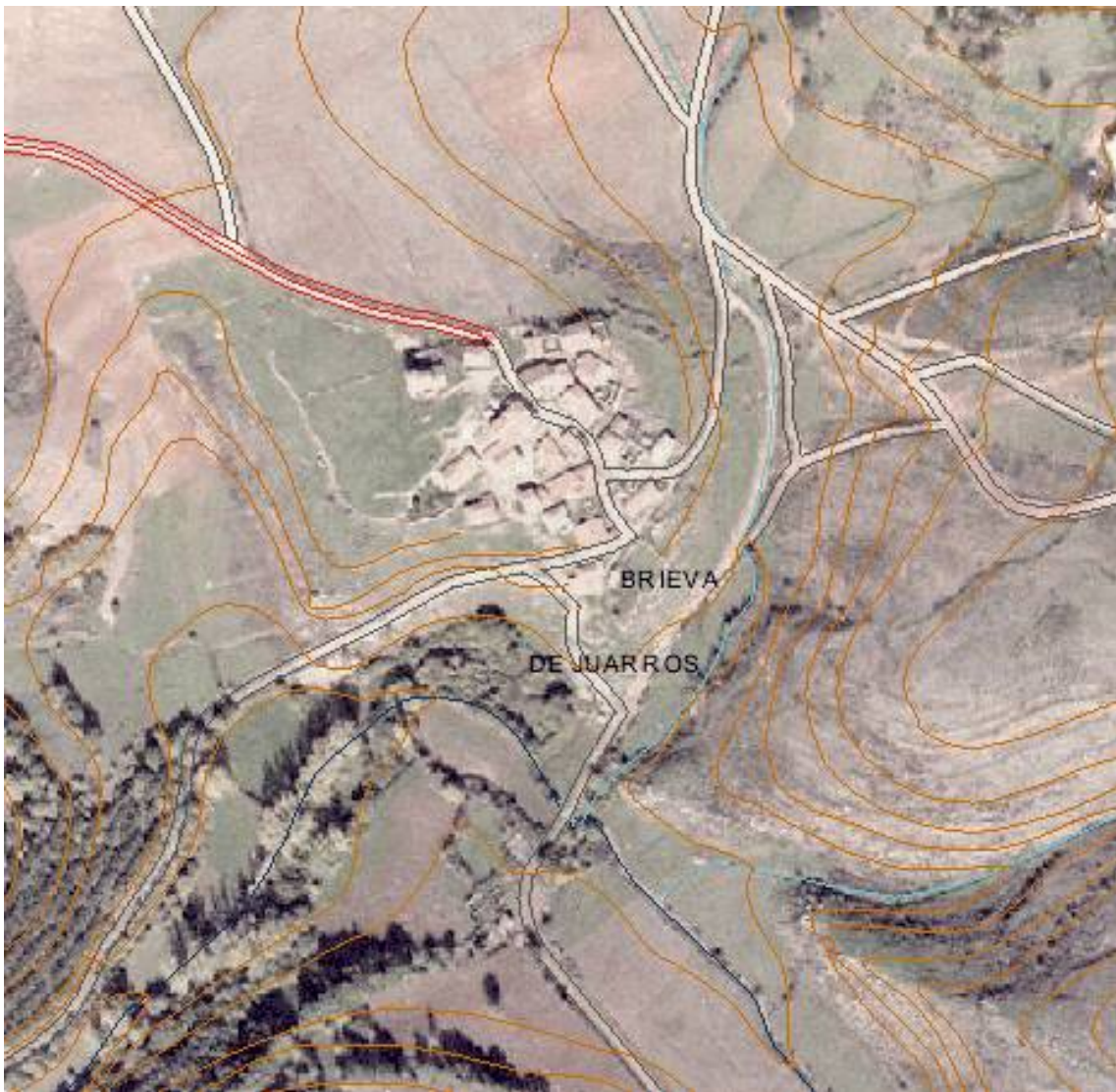
Brieva de Juarros: foto aérea.