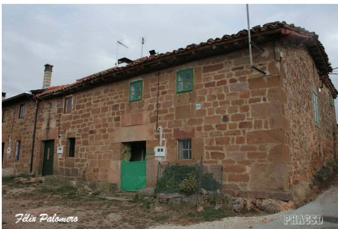
Brieua de Juarros: arquitectura popular.