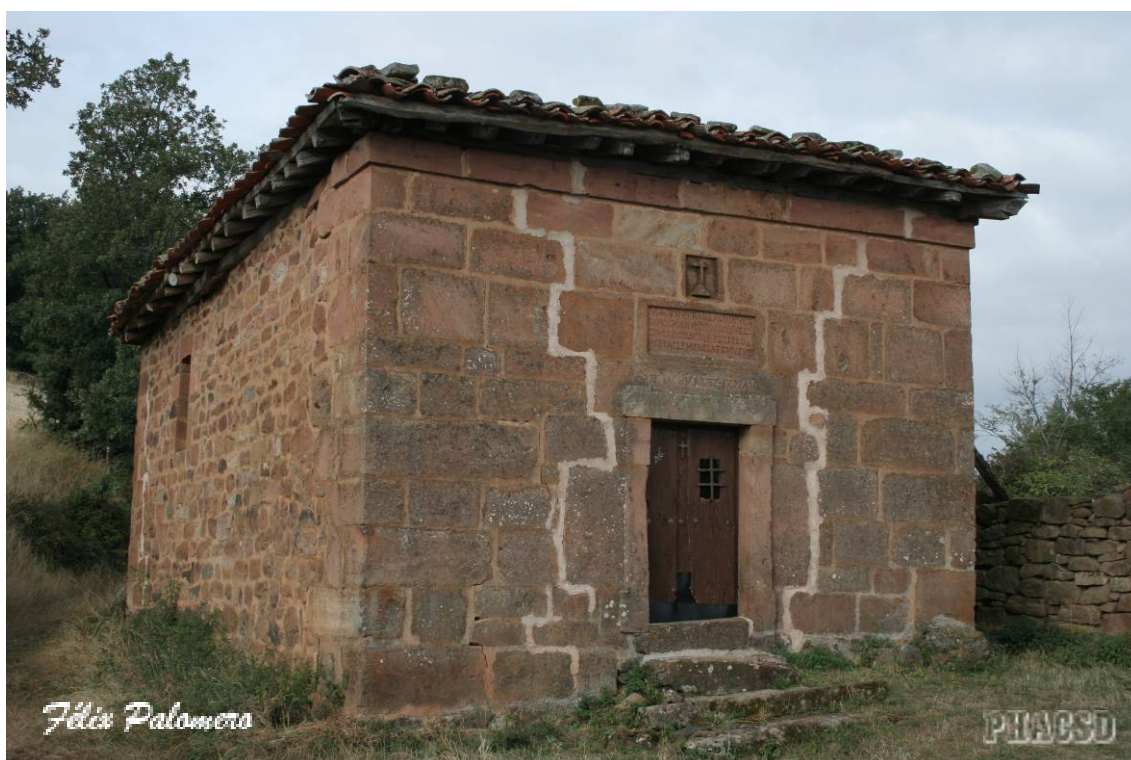
Brieva de Juarros: ermita.