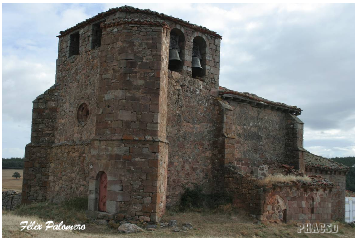
Brieva de Juarros: iglesia parroquial, vista desde el sudoeste.