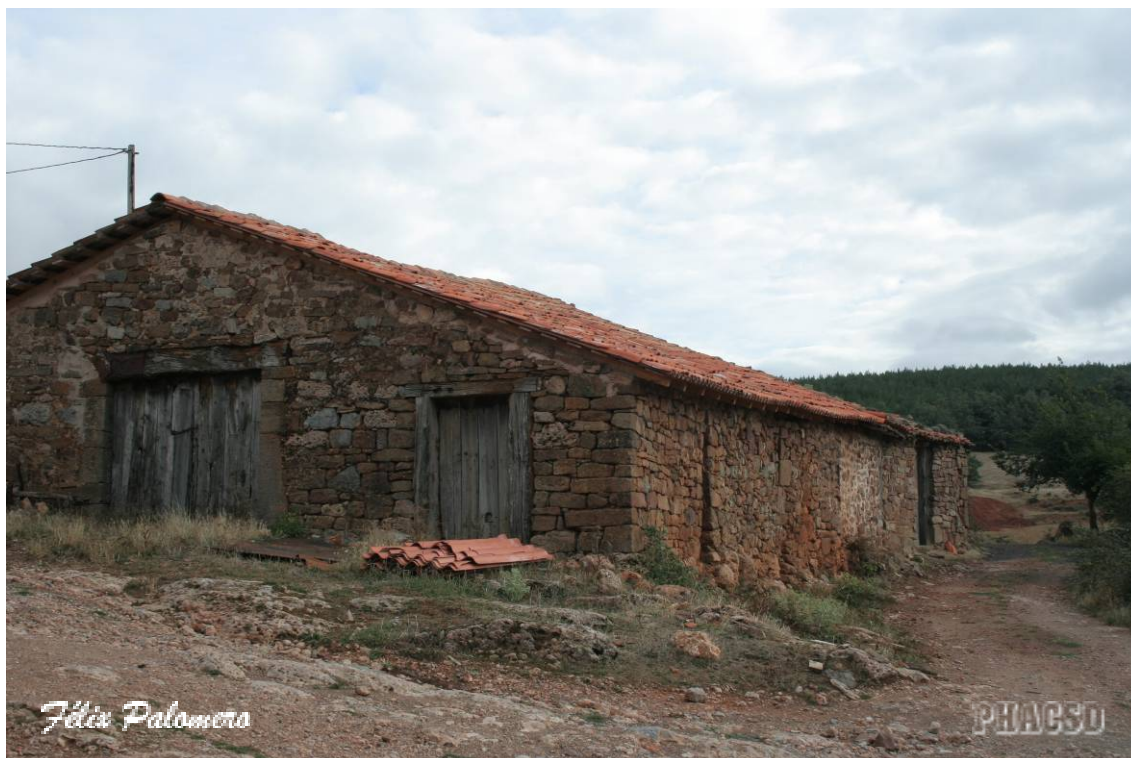
Brieva de Juarros: arquitectura popular, tenadas.