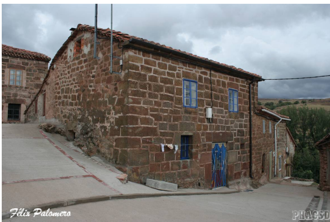
Cabañas: arquitectura popular.