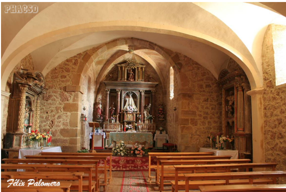
Cabañas- Matalindo: nave del templo.