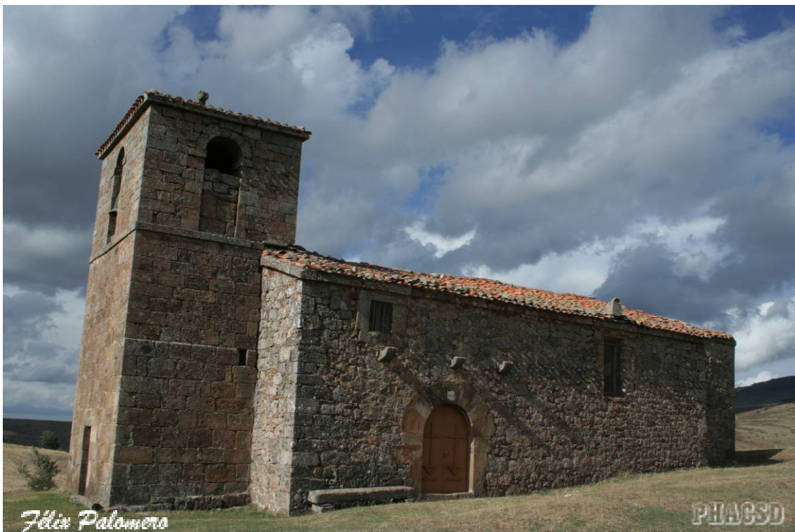
Cabañas-Matalindo: iglesia parroquial.