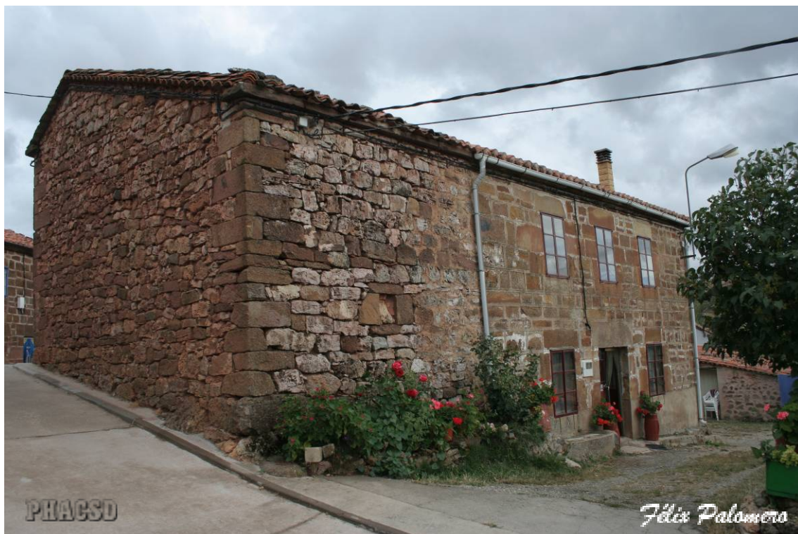
Cabañas: arquitectura popular.