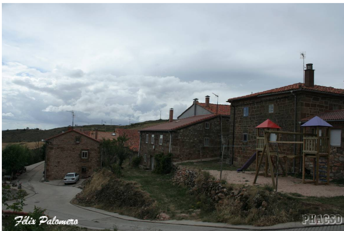
Cabañas: arquitectura popular.