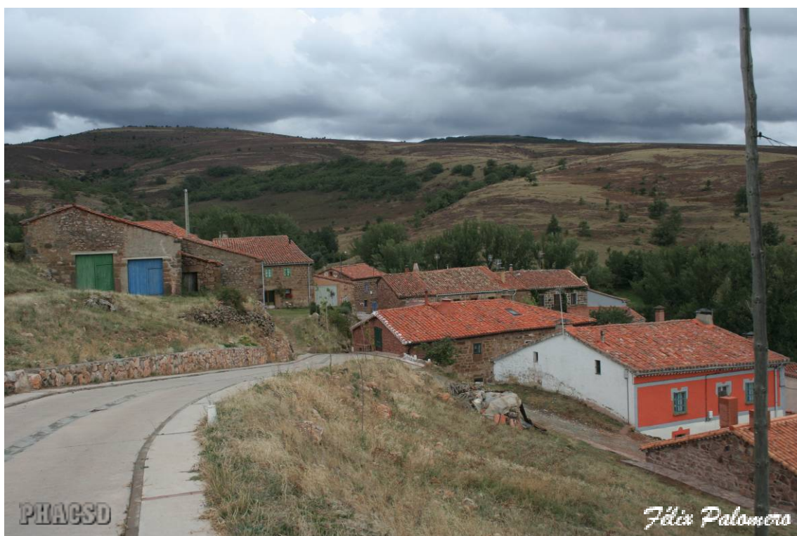
Cabañas: vista del entorno.