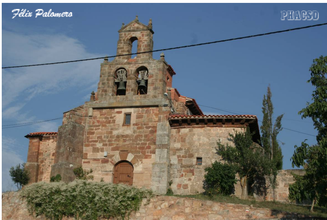
Cuzcurrita de Juarros: iglesia parroquial, fachada occidental.