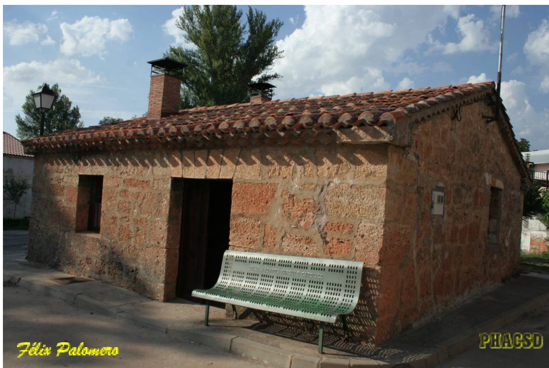
Cuzcurrita de Juarros: arquitectura popular, molino.