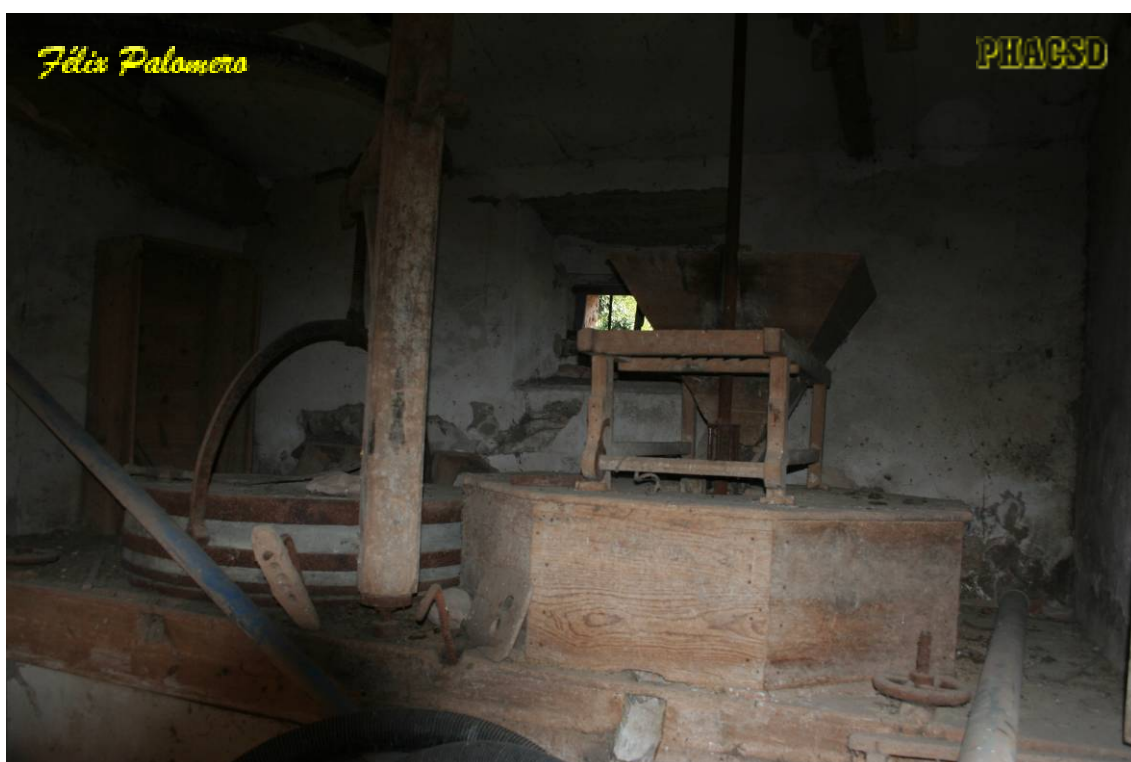
Cuzcurrita de Juarros: arquitectura popular, molino.