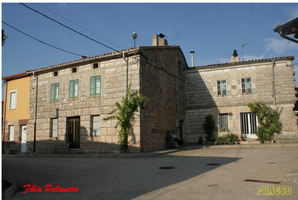
Cuzcurrita de Juarros: arquitectura popular.