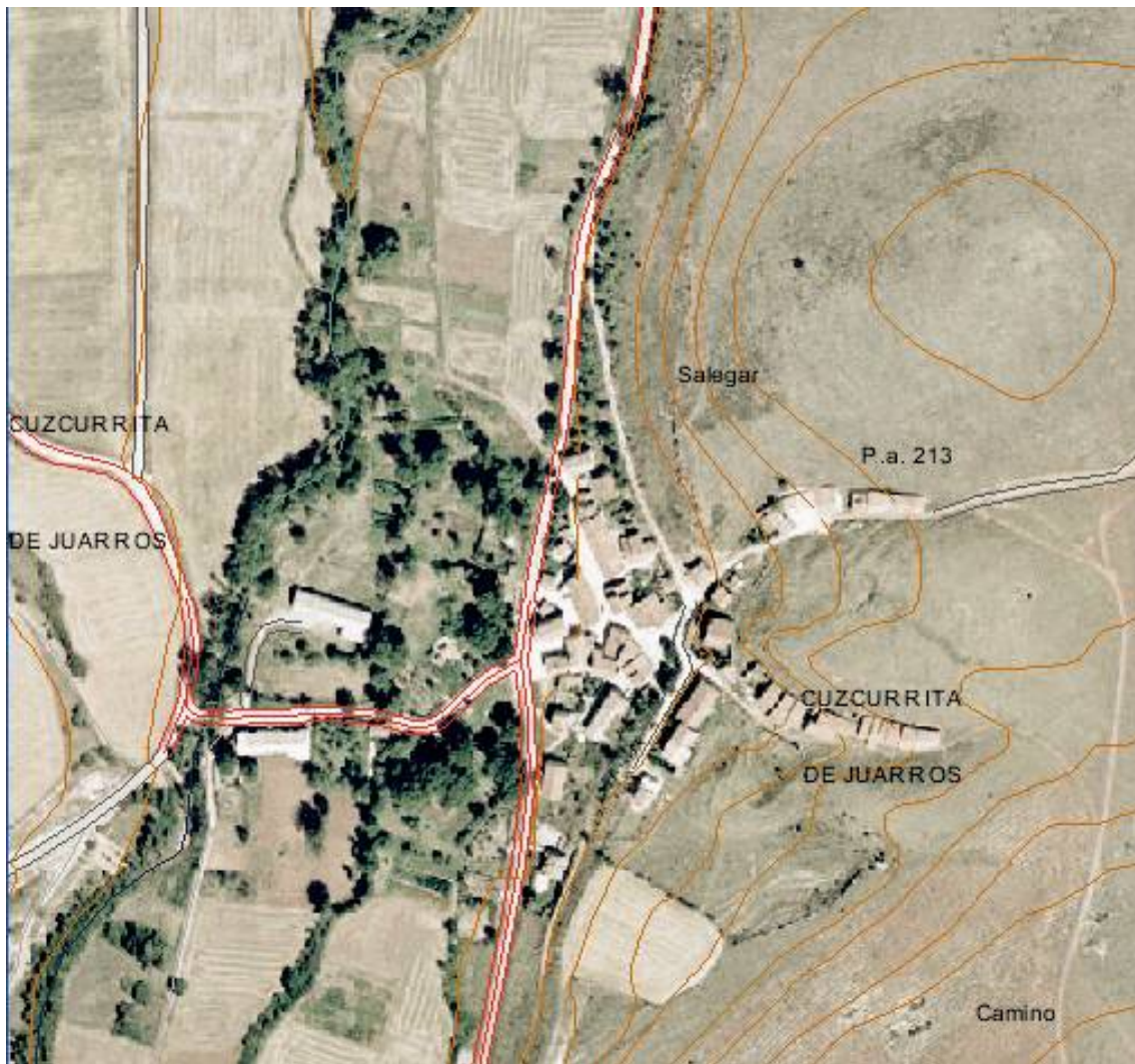
Cuzcurrita de Juarros: foto aérea.