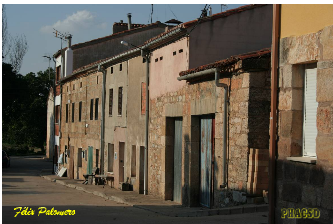
Cuzcurrita de Juarros: arquitectura popular.